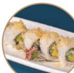
10.00€ 5.00€ 89. VEGETALE MANGO Mango,cetriolo,avocado, granelle patate