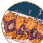
14.00€ 7.00€ 111. EBITEN NERA SALMONE Gamberi* fritti,salmone, cipolla fritta,teriyaki