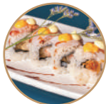
12.00€ 6.50€ 91. EBITEN SPECIALE Gamberi* fritti,pesce misto scottato, maionese,teriyaki,spicymaio