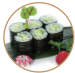
5.00€ 2.50€ 63. HOSOMAKI CETRIOLO 6PZ