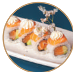
12.00€ 6.50€ 82. SAVOCADO PHILA Salmone,avocado,philadelphia