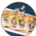
12.00€ 6.50€ 96. EBITEN AVOCADO KADAIFI Gamberi* fritti,avocado, kadaifi,teriyaki