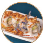
10.00€ 5.00€ 98. CHICKEN ROLL Pollo* fritto,avocado,cipolla fritta, teriyaki,maionese