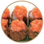
9.00€ 4.50€ 67. HOSOMAKI FRITTO 6PZ Fritto con salmone, tartare salmone,kadaifi,teriyaki