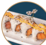
10.00€ 5.00€ 106. SPICY SALMON Salmone,sesamo,spicymaio