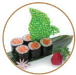
6.00€ 3.00€ 60. HOSOMAKI SALMONE 6PZ