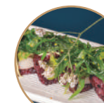
14.00€ 7.00€ 114. CALIFORNIA NERA WAKAME Surimi*,avocado,cetriolo, maionese,wakame