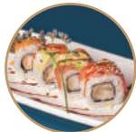
12.00€ 6.50€ 92. EBITEN RAINBOW Gamberi* fritti,pesce misto, sesamo,teriyaki