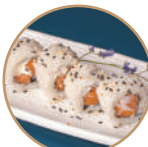
10.00€ 5.00€ 103. SAPHI ROLL Salmone,philadelphia,sesamo