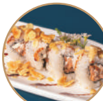
10.00€ 5.00€ 99. MIURA MANDORLE Salmone cotto,philadelphia, mandorle,teriyaki