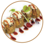
9.00€ 4.50€ 68. HOSOMAKI PHILA 6PZ Fritto con salmone, philadelphia,teriyaki