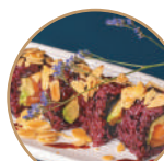
14.00€ 7.00€ 112. SAVODADO NERA MANDORLE Salmone,avocado, mandorle,teriyaki