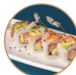
12.00€ 6.50€ 85. SAVOCADO RAINBOW Salmone,avocado, pesce misto,sesamo