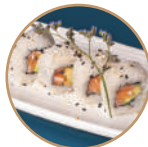
10.00€ 5.00€ 80. SAVOCADO ROLL Salmone,avocado,sesamo