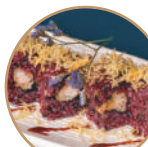
14.00€ 7.00€ 110. EBITEN NERA Gamberi* fritti, granelle patate,teriyaki