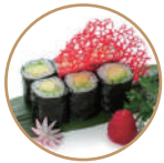
5.00€ 2.50€ 62. HOSOMAKI AVOCADO 6PZ