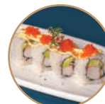
10.00€ 5.00€ 87. CALIFORNIA TOBIKO Surimi*,avocado,cetriolo, tobiko,maionese