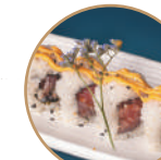
10.00€ 5.00€ 107. SPICY TUNA Tonno,sesamo,spicymaio