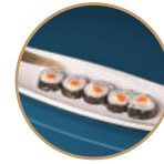
9.00€ 4.50€ 78. FUTOMAKI SAKE PHILA 5PZ Salmone e philadelphia