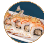
12.00€ 6.50€ 93. EBITEN SALMONE SCOTTATO Gamberi* fritti,salmone scottato, granelle patate,teriyaki