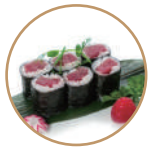
6.00€ 3.00€ 61. HOSOMAKI TONNO 6PZ