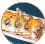
12.00€ 6.50€ 97. EBITEN MANGO Gamberi* fritti,mango,pistacchio, salsa mango e teriyaki