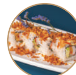
10.00€ 5.00€ 86. CALIFORNIA CIPOLLA Surimi*,avocado,cetriolo, cipolla fritta,teriyaki,maionese