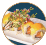
12.00€ 6.50€ 84. SAVOCADO MANGO Salmone,avocado,mango, pistacchio e salsa mango