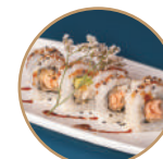
10.00€ 5.00€ 100. SALMONE FRITTO PHILA Salmone fritto,philadelphia, sesamo,teriyaki