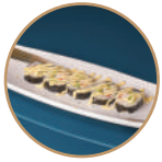
9.00€ 4.50€ 76. FUTOMAKI CALIFORNIA 5PZ Surimi*, avocado, cetriolo, maionese