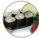
5.00€ 2.50€ 64. HOSOMAKI EBITEN 6PZ Gambero* fritto,teriyaki