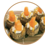
9.00€ 4.50€ 65. HOSOMAKI MANGO 6PZ Fritto con salmone, philadelphia, mango, teriyaki