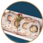
10.00€ 5.00€ 90. EBITEN ROLL Gamberi* fritti,sesamo,teriyaki