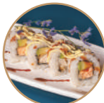
10.00€ 5.00€ 101. SALMONE FRITTO AVOCADO Salmone fritto,avocado, maionese,sesamo,teriyaki