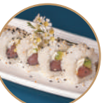
10.00€ 5.00€ 105. TOVOPHI ROLL Tonno,philadelphia, avocado,sesamo