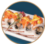
12.00€ 6.50€ 95. EBITEN SPICY Gamberi* fritti,tartare salmone, teriyaki,spicymaio