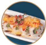
12.00€ 6.50€ 88. CALIFORNIA SPICY Surimi*,avocado,cetriolo,salmone, kadaifi,spicymaio,teriyaki