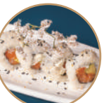
10.00€ 5.00€ 104. SAVOPHI ROLL Salmone,philadelphia, avocado,sesamo