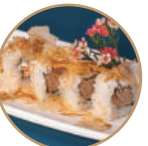
10.00€ 5.00€ 102. TONNO SPECIALE Tonno cotto,scaglie di pesce