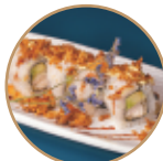
10.00€ 5.00€ 98.CHICKEN ROLL Pollo* fritto,avocado,cipolla fritta, teriyaki,maionese