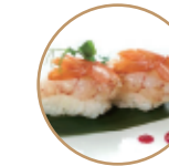
4.00€ 2.00€ 43. NIGIRI GAMBERO CRUDO