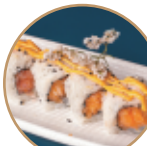
10.00€ 5.00€ 106.SPICY SALMON Salmone,sesamo,spicymaio