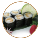
5.00€ 2.50€ 64. HOSOMAKI EBITEN 6PZ Gambero* fritto,teriyaki