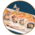
13.00€ 6.50€ 93.EBITEN SALMONE SCOTTATO Gamberi* fritti,salmone scottato, granelle patate,teriyak