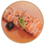
7.00€ 3.50€ 21. CARPACCIO SALMONE 6pz Condito con salsa ponzu e sesamo