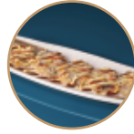
10.00€ 5.00€ 77.FUTOMAKI CALIFORNIA FRITTO 5PZ Surimi*,avocado,cetriolo,maionese,teriyaki