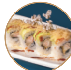
13.00€ 6.50€ 96.EBITEN AVOCADO KADAIFI Gamberi* fritti,avocado, kadaifi,teriyaki