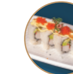
10.00€ 5.00€ 87.CALIFORNIA TOBIKO Surimi*,avocado,cetriolo, tobiko,maionese