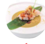
4.50€ 2.25€ 37. NIGIRI BRANZINO SCOTTATO Malonese, salsa teriyaki e kadaifi