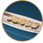
9.00€ 4.50€ 76.FUTOMAKI CALIFORNIA 5PZ Surimi*, avocado, cetriolo, maiones