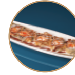
10.00€ 5.00€ 79.FUTOMAKI SAKE PHILA FRITTO 5PZ Salmone,philadelphia,teriyaki