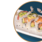
13.00€ 6.50€ 85.SAVOCADO RAINBOW Salmone,avocado, pesce misto,sesamo