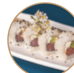
10.00€ 5.00€ 105.TOVOPHI ROLL Tonno,philadelphia, avocado,sesamo