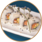
10.00€ 5.00€ 80.SAVOCADO ROLL Salmone,avocado,sesamo