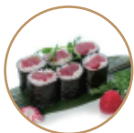
6.00€ 3.00€ 61. HOSOMAKI TONNO 6PZ