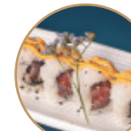
10.00€ 5.00€ 107.SPICY TUNA Tonno,sesamo,spicymaio