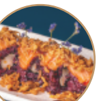
14.00€ 7.00€ 111.EBITEN NERA SALMONE Gamberi* fritti,salmone, cipolla fritta,teriyaki