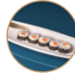
9.00€ 4.50€ 78.FUTOMAKI SAKE PHILA 5PZ Salmone e philadelphia