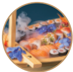
44.00€ 22.00€ 116. BARCA 44PZ 12 nigiri, 12 sashimi, 12 hosomaki, 8 uramaki