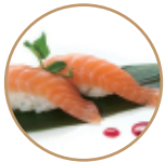
3.50€ 1.75€ 40. NIGIRI SALMONE