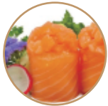
6.00€ 3.00€ 51. GUNKAN SALMONE