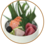
11.00€ 5.50€ 10. SASHIMI MISTO