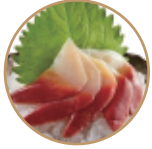
8.00€ 4.00€ 16 - SASHIMI HOKKIGAI 4pz