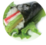
6.00€ 3.00€ 72. TEMAKI CALIFORNIA Surimi di granchio*, avocado, malonese