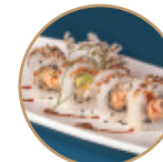
10.00€ 5.00€ 100.SALMONE FRITTO PHILA Salmone fritto,philadelphia, sesamo,teriyaki