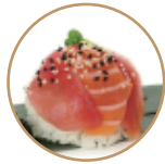
8.00€ 4.00€ 32. CHIRASHI TONNO Riso con tonno e sesamo