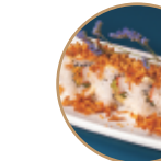
10.00€ 5.00€ 86.CALIFORNIA CIPOLLA Surimi*,avocado,cetriolo, cipolla fritta,teriyaki,maionese