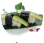
3.50€ 1.75€ 46. NIGIRI AVOCADO