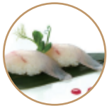
3.50€ 1.75€ 41. NIGIRI BRANZINO