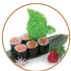
6.00€ 3.00€ 60. HOSOMAKI SALMONE 6PZ