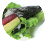
6.00€ 3.00€ 71. TEMAKI TONNO AVOCADO