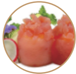
6.00€ 3.00€ 53. GUNKAN TONNO