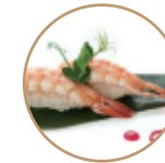
3.50€ 1.75€ 44. NIGIRI GAMBERO COTTO