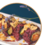
14.00€ 7.00€ 112.SAVODADO NERA MANDORLE Salmone,avocado, mandorle,teriyaki