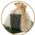
5.00€ 2.50€ 33. ONIGIRI MIURA Salmone cotto, philadelphia e sesamo