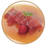
9.00€ 4.50€ 22. CARPACCIO TONNO 6pz Condito con salsa ponzu e sesamo