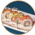
13.00€ 6.50€ 92.EBITEN RAINBOW Gamberi* fritti, pesce misto, sesamo,teriyaki