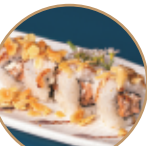
10.00€ 5.00€ 99.MIURA MANDORLE Salmone cotto,philadelphia, mandorle,teriyaki