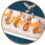
13.00€ 6.50€ 82.SAVOCADO PHILA Salmone,avocado,philadelphia