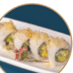
10.00€ 5.00€ 89.VEGETALE MANGO Mango,cetriolo,avocado, granelle patate