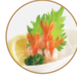
8.00€ 4.00€ 14. SASHIMI GAMBERI CRUDI 3pz