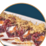
14.00€ 7.00€ 113.SAPHI NERA Salmone,philadelphia, granelle patate, teriyaki