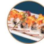
13.00€ 6.50€ 95.EBITEN SPICY Gamberi* fritti,tartare salmone, teriyaki,spicymaio