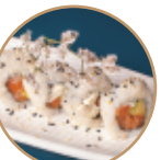
10.00€ 5.00€ 104.SAVOPHI ROLL Salmone,philadelphia, avocado,sesamo