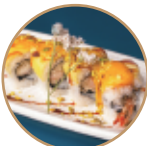
13.00€ 6.50€ 97.EBITEN MANGO Gamberi* fritti,mango,pistacchio, salsa mango e teriyaki