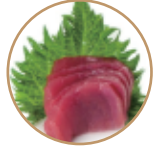
8.00€ 4.00€ 13. SASHIMI TONNO