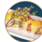
13.00€ 6.50€ 84.SAVOCADO MANGO Salmone,avocado,mango, pistacchio e salsa mango