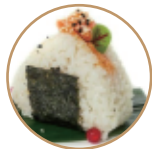
5.00€ 2.50€ 35. ONIGIRI SALMONE CRUDO Salmone crudo e tobiko