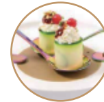
6.00€ 3.00€ 56. GUNKAN ZUCCHINE PHILA