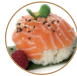
8.00€ 4.00€ 31. CHIRASHI SALMONE Riso con salmone e sesamo