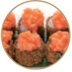
9.00€ 4.50€ 67. HOSOMAKI FRITTO 6PZ Fritto con salmone,tartare salmone, kadaifi,teriyaki