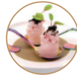
6.00€ 3.00€ 54. GUNKAN BRANZINO