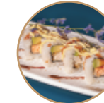
10.00€ 5.00€ 101.SALMONE FRITTO AVOCADO Salmone fritto,avocado,maionese, sesamo,teriyaki