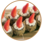
9.00€ 4.50€ 66. HOSOMAKI FRAGOLA 6PZ Fritto con salmone, philadelphia, fragola, teriyaki