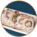
10.00€ 5.00€ 90.EBITEN ROLL Gamberi* fritti,sesamo,teriyaki