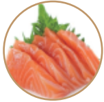
6.00€ 3.00€ 11. SASHIMI SALMONE