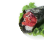
6.00€ 3.00€ 74. TEMAKI SPICY TUNA Tartare tonno, spicymalo