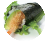
6.00€ 3.00€ 75. TEMAKI EBITEN Gambero fritto, avocado, teriyaki