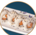
10.00€ 5.00€ 103.SAPHI ROLL Salmone,philadelphia,sesamo