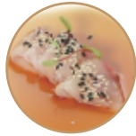
7.00€ 3.50€ 23. CARPACCIO BRANZINO 6pz Condito con salsa ponzu e sesamo