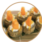
9.00€ 4.50€ 65. HOSOMAKI MANGO 6PZ Fritto con salmone, philadelphia, mango, teriyaki