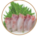
6.00€ 3.00€ 12. SASHIMI BRANZINO