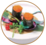
6.00€ 3.00€ 57. GUNKAN TOBIKO