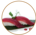
4.00€ 2.00€ 42. NIGIRI TONNO