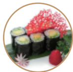
5.00€ 2.50€ 62. HOSOMAKI AVOCADO 6PZ