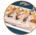
13.00€ 6.50€ 91.EBITEN SPECIALE Gamberi* fritti,pesce misto scottato, maionese,teriyaki,spicymaio