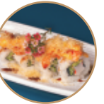
13.00€ 6.50€ 88.CALIFORNIA SPICY Surimi*,avocado,cetriolo,salmone, kadaifi,spicymaio,teriyaki