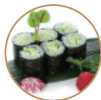
5.00€ 2.50€ 63. HOSOMAKI CETRIOLO 6PZ