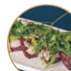
14.00€ 7.00€ 114.CALIFORNIA NERA WAKAME Surimi*,avocado,cetriolo, maionese,wakame