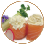
6.00€ 3.00€ 52. GUNKAN SALMONE PHILADELPHIA