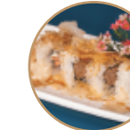
10.00€ 5.00€ 102.TONNO SPECIALE Tonno cotto,scaglie di pesce