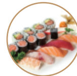
20.00€ 10.00€ 115. SUSHI MISTO 20pz 6 nigiri, 6 hosomaki, 4 uramaki e 4 sashimi