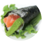
6.00€ 3.00€ 70. TEMAKI SALMONE AVOCADO