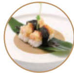
3.50€ 1.75€ 45. NIGIRI GAMBERO FRITTO