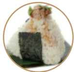
5.00€ 2.50€ 34. ONIGIRI TONNO COTTO Tonno cotto e scaglie di pesce