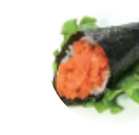
6.00€ 3.00€ 73. TEMAKI SPICY SALMON Tartare salmone, spicymalo