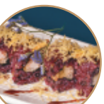
14.00€ 7.00€ 110.EBITEN NERA Gamberi* fritti, granelle patate,teriyaki